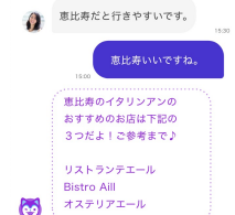
サジェスト画面イメージ