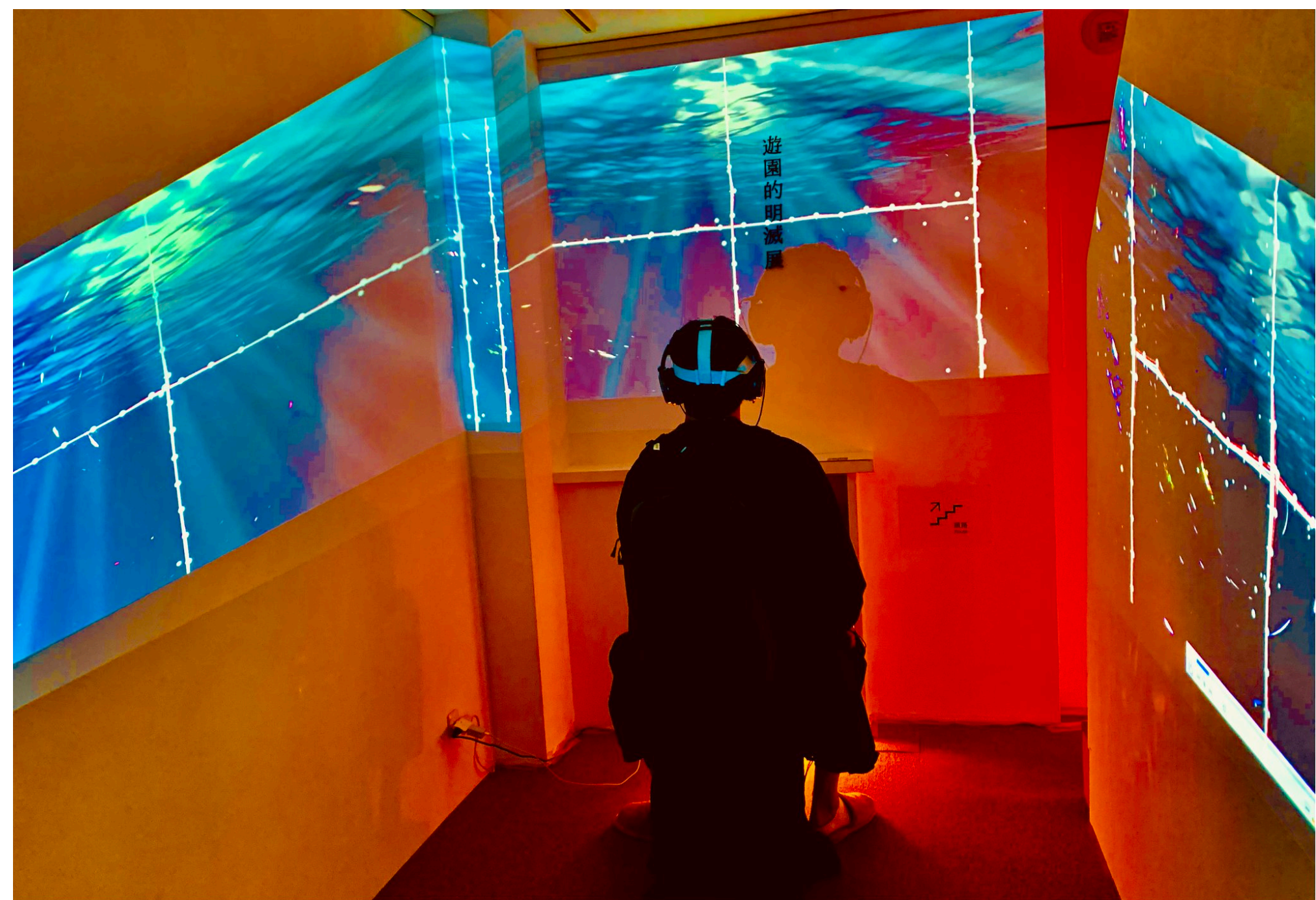
(プロトタイプイメージ / 2021 10/24撮影)

現実とVR空間の境界を曖昧することでVRへの「没入」を促進 瞑想をする際、集中を乱す物事がVR空間上には存在しない