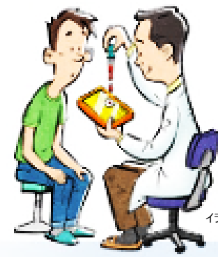
イラスト提供：スタジオエル