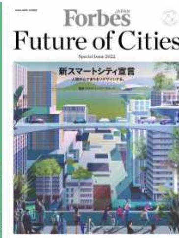
Forbes JAPAN 2022年9月号 別冊「Future of Cities」