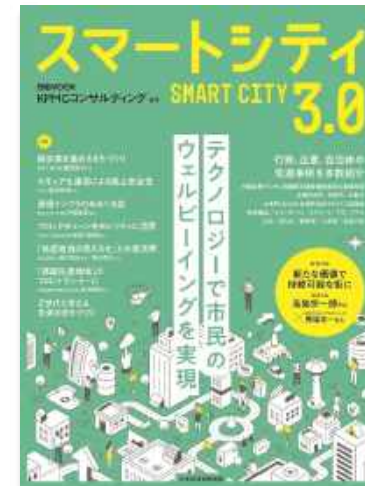
日経MOOK 「スマートシティ3.0」

スマートシティ分野の東大発スタートアップ (MaaS・地域活性化・旅行・不動産テック)